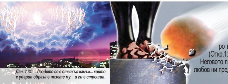
Дан. 2:34: ...догдето се е отсаял камък... който е ударил образа в нозете му... и ги е строшил.

В това време, когато хората се мъчат да обединят европейските нации, а над света се сгромоляват катастрофи и войни, пророкът Даниил вижда как огромен камък пада на краката на образа и напълно го разрушава (Дан.2:34-35). Този камък означава пришествието на Исус Христос (Дан.2:44-45). Христос скоро ще се възвръща на небесните облаци с ангелите си, така че всеки ще разбере това (Откр.1:7). За да може човечеството да се подготви да срещне събитията на края на времето и Неговото пришествие, за да помогне на хората да издържат на съда, Богът поради безмерната си любов ни предупреждава с последната благодатна вест, която намираме в Откровението 14 глава.