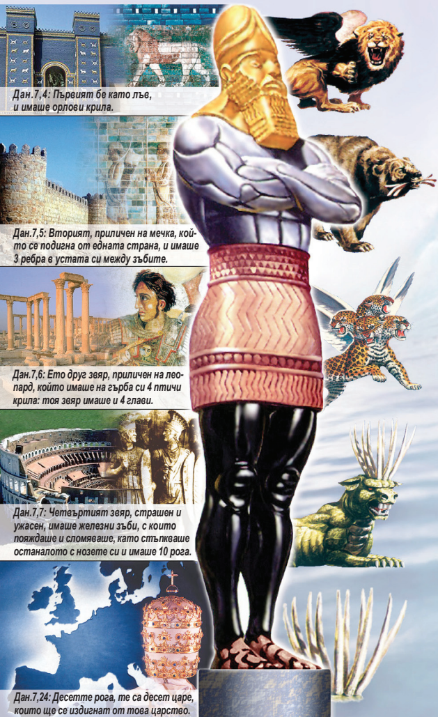
Дан. 7,4: Първият бе като лъв, и имаше орлови крила.

Преди 2600 години чрез пророка Даниил е предсказано възникването и развитието на великите световни държави: Вавилон, Мидо-Персия, Гърция, Рим и съвременната Европа . В нощно видение пророкът видял образ, на който частите на тялото символизирали строгата последователност на възникването на тези държави: "Главата на тоя образ е била от чисто злато, гърдите му и мишиците му от сребро, коремът му и бедрата му от мед, краката му от желязо, нозете му отчасти от желязо, а отчасти от кал" (Дан.2:32-33). Тези велики световни държави и техните особени отличителни знаци били показани на пророка също и във вида на животни: "Тия четири големи звяра, са четирима царе, които ще се издигнат от земята" (Дан.7:17), които като "четирите небесни ветрища избухнаха върху голямото море" (Дан.7:2). В Откр. 17:15 се обяснява, че "водите" - това са "люде и множества, народи и езици". "Ветрища" - та това е символът на война (Ер.4:11-16). Четирите небесни вятъра борещи се на великото море представляват ужасните завоевателни войни, посредством които тези империи идват на власт.