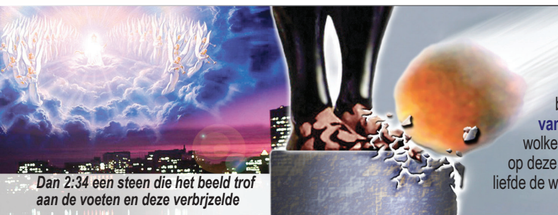
Dan 2:34 een steen die het beeld trof aan de voeten en deze verbrzeldde

T enslotte zag de profeet Daniel aan het einde,wanneer de volkeren van Europa zich trachten te verbinden, wanneer Kerk en Staat één wordt en de wereld in toenemende mate geteisterd wordt door rampen en oorlogen. Een grote steen het beeld aan zijn voeten treft, en het vernietigd. Deze steen is een beeld van de wederkomst van Jezus Christus (Dan.2:34,35; Psalm 18:32) Christus zal spoedig wederkomen op de wolken des hemels met al zijn engelen, en iedereen zal hem zien. (Openb.1:7). Om de mens op deze gebeurtenis voor te bereiden en te helpen staan in het oordeel. Waarschuwt God in zijn liefde de wereld, door het brengen van een laatste genadeboodschap die u vindt in Openb.14: