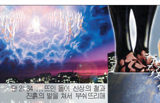
단 2:34 ... 쓰인 돌이 산상의 철과 진흙의 발을 쳐서 부서뜨리매

선지자 다니엘은 그의 계시에서, 사람들이 유럽과 세계를 서로 연합시키기 위해서 노력하고, 이 세상에 재앙들과 전쟁들이 빈번해질 때에 하늘로부터 큰 돌이 와서 그 산상의 발과 몸을 산산히 부서뜨리는 것을 보았다. 이 큰 돌은 예수 그리스도의 재 강림을 의미한다(단 2:34~35, 44, 시 18:32). 그리스도께서는 곧 천사들과 구름을 타고 오실 것이며, 모든 사람들이 그분을 볼 것이다(계 1:7). 우리 인류들이 이 엄청난 사건인 예수재림을 위하여 잘 준비되고 심판 날에 설 수 있도록 하나님께서는 사랑으로 경고하고 계시는데, 그 자비의 경고의 기별들은 요한 계시록 14:6~12절에서 볼 수 있다.