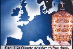
Dan. 7:24 Quanto aos dez chifres, daquele mesmo reino se levantarão dez reis.

Devido à IMIGRAÇÃO MACIÇA DURANTE O PERÍODO DE 351-476 D.C., o Império Romano foi dividido em 10 pequenos reinos europeus (Note os dez chifres e os dez dedos). Os chifres divididos mas prósperos, e a afirmação de que não se uniriam a mistura de ferro e de barro dos dez dedos, representa a impossibilidade de uma Europa Unida.