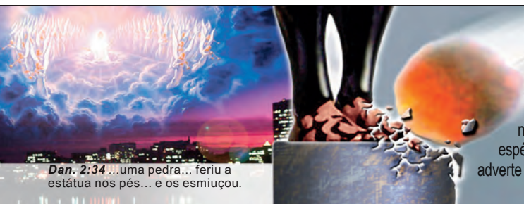
Dan. 2:34 ...uma pedra... feriu a estátua nos pés... e os esmiuçou.

O profeta Daniel viu que no tempo em que o homem procurasse unir as nações da Europa e do mundo, seria visitado cada vez mais por catástrofes e guerras; uma grande pedra chocará de encontro aos pés da estátua e a destruirá por completo. Essa pedra representa a 2ª Vinda de Jesus Cristo (Dan. 2:34-35, 44; Salmos 18:31). Cristo em breve virá sobre as nuvens do céu com os Seus anjos, visível para toda a humanidade (Ap. 1:7). A fim de preparar a espécie humana para este evento e ajudá-la a estar em pé durante o juízo, Deus, em Seu grande amor, adverte a humanidade com a última mensagem de misericórdia que se encontra em Apocalipse 14:6-12.