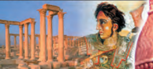
Дан. 7;6: Друга звер, као рис, имаше на леђима 4 крила као птица.