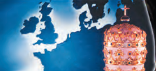
Дан. 7;24: Десет рогова јесу 10 царева који ће настати из тога царства.