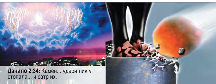
Данило 2:34: Камен... удари лик у стопала... и сатр их.

Пророк Данило је унапред видео време у коме ће људи покушавати да уједине европске народе. У то време, када ће свет бити погођен катастрофама и ратовима, велики камен погодиће кил и стопала и потпуно ће га уништити. Овај камен представља долазак Исуса Христа (Данило 2;34-35,44). Христос ће ускоро доћи на облаку славе са својим анђелима, и "угледаће Га свако око" (Откривење 1;7). С обзиром да је човечанству неопходна припрема за такав догађај да би људи могли стајати на небеском суду, Бог упозорава човечанство последњом поруком милости која је записана у Откривењу 14;6-12.