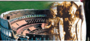
Дан.7;7: 4-а звер које се требаше бојати беше страшна и врло јака, имаше велике зубе гвозедене, јеђаше и сатираше... и имаше 10 рогова.