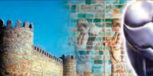
Дан.7;5: Друга звер беше као медвед, и стаде с једне стране и имаше 3 ребра у устима.