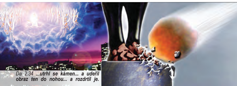
Da 2,34 „utrhl se kámen... a udeřil obraz ten do nohou... a rozdřítel je.“

V době, kdy se lidé snaží spojit Evropské národy a kdy je svět ohrožován přibývajícím katastrofami, vidí prorok Daniel, jak padá velký kámen na nohy té sochy a úplně ji zničí. Tento kámen znamená příchod Ježíše Krista (Dan 2,34-35,44; Ž 18,32). Kristus přijde brzy v nebeských oblacích v doprovodu všech svých andělů, a každý ho uvidí (Zj 1,7). Aby byli lidé na tento okamžik připraveni a mohlo jim být pomoci, aby obstáli při soudu, varuje je Bůh svou láskou skrze Jeho poslední poselství milosti, poselství třech andělů, která najdeme ve Zjevení 14 kap.: